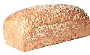
Danskt Rågbröd skivad